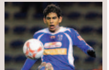
* Le Diable rouge connaît bien les deux clubs.