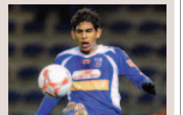
* Le Diable rouge connaît bien les deux clubs.