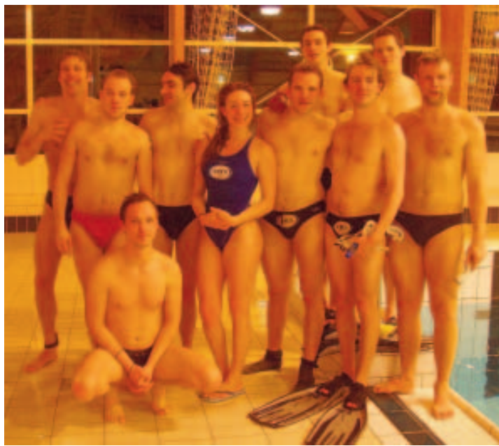
Le BUWH, avec 57 membres, est le plus gros club de Belgique.