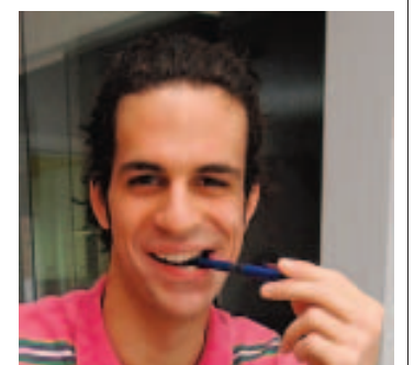
c. Lo. Raphaël Galeri. ■ FROMONT

les autres sont manifestement en état de s'entraîner, même Allou et Rinaldi, dont les genoux n'avaient guère été ménagés dimanche à Cappellen. Pour info, les Woluwéens valides recevaient hier une formation espoir de Lokeren, agrémentée de quelques joueurs du noyau A. Le tout pour préparer la venue de Seraing samedi soir en championnat. «